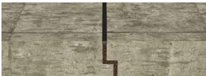
Junta de dilatação descontínua