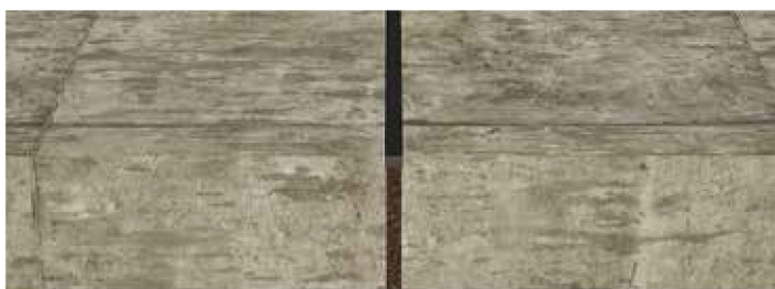
Junta de dilatação contínua